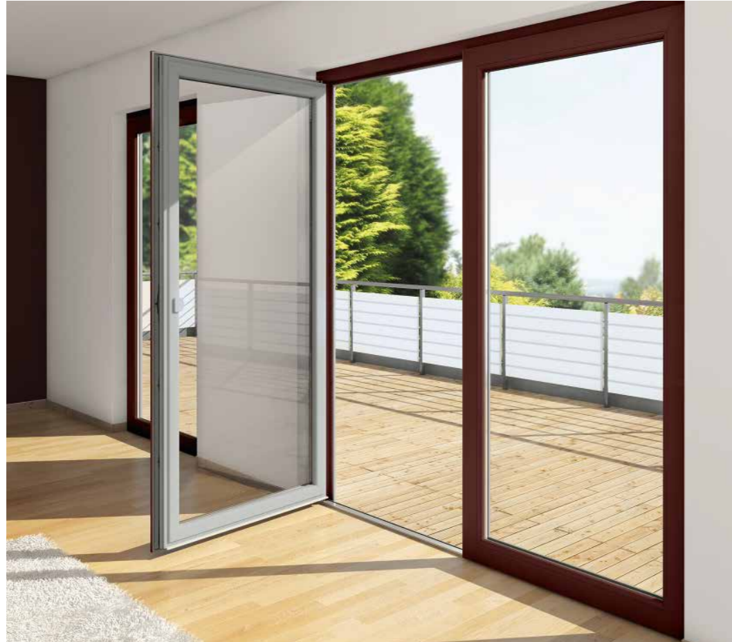
Kreative Möglichkeiten bei der außen- und innenseitigen Gestaltung mit Schüco AutomotiveFinish.