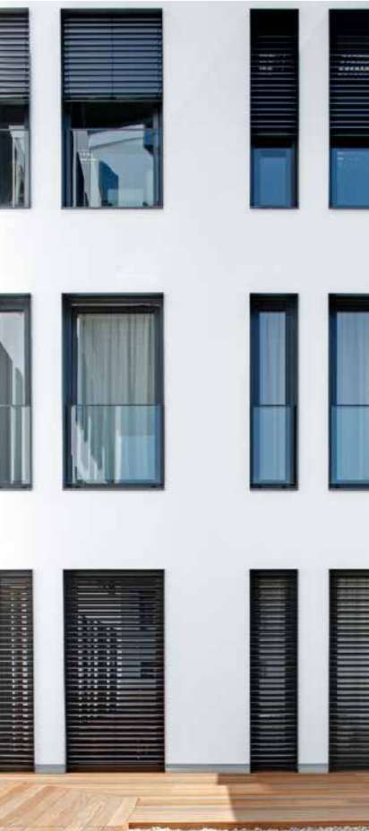
Mit Schüco AutomotiveFinish lassen sich neue gestalterische Impulse mit preislich attraktiver Leistung verbinden.